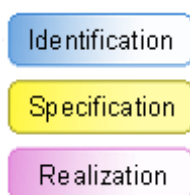
OBRÁZEK 1: FÁZE METODY SOMA

Není překvapením, že v oblasti návrhu řešení SOA nacházíme mnoho společných elementů, které se objevují v obou metodách. Primárně mluvíme o těchto třech fázích: